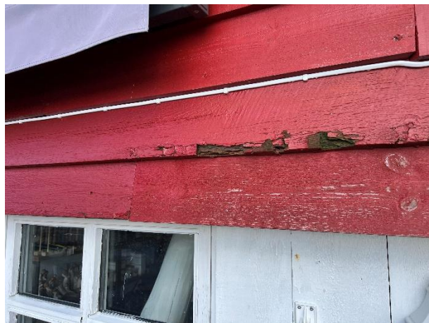
Råteskader på kledning.