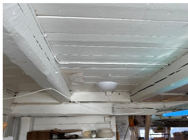
Malte flater på innvendige tak 1. etasje.