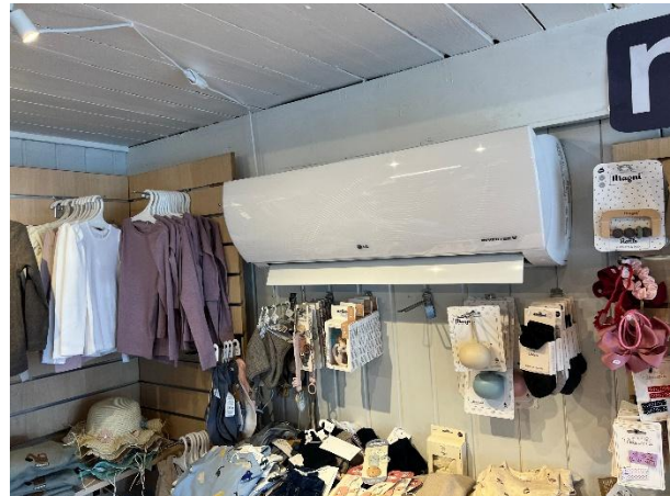
Montert varmepumpe i butikk.