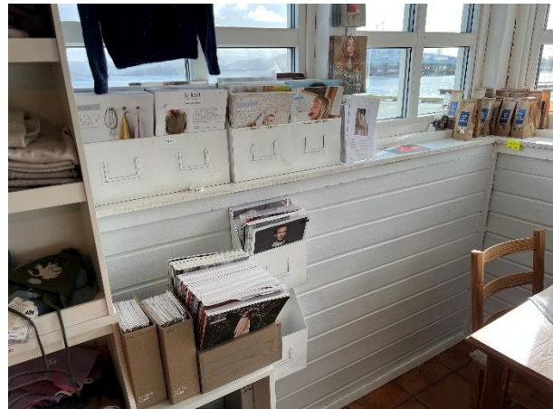
Malt panel på vegger i 1. etasje.