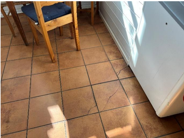
Fliser på gulv i 1. etasje. Sprekk i fliser.