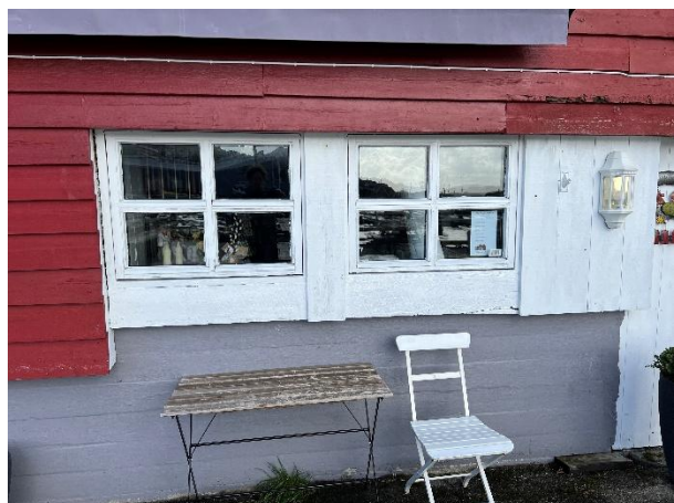
Vinduer av forskjellig alder.