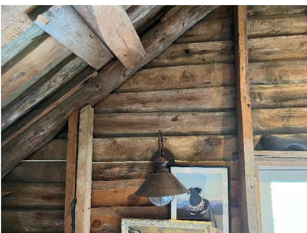
Synlig kledningsbord på vegger loft.