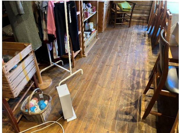
Innvendige gulv av tre på loft.