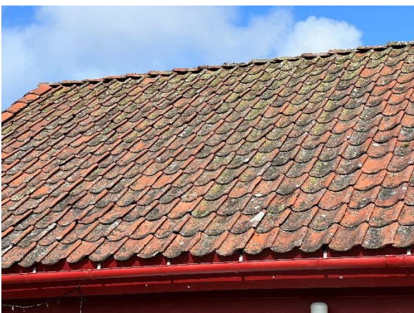
Eldre takstein på kaihuset.