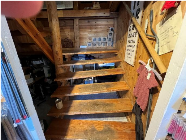
Innvendige trapper av tre.