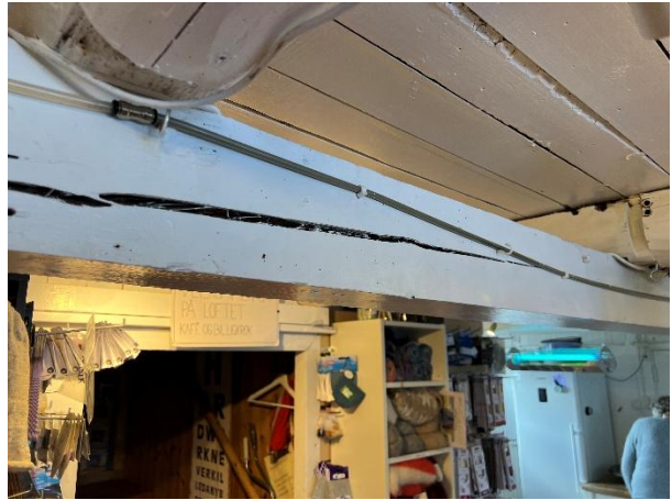
Synlige trebjelker og tresøyler i 1. etasje. Sprekker.