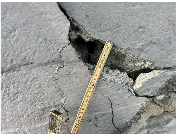
Sprekker i grunnmur mot øst.