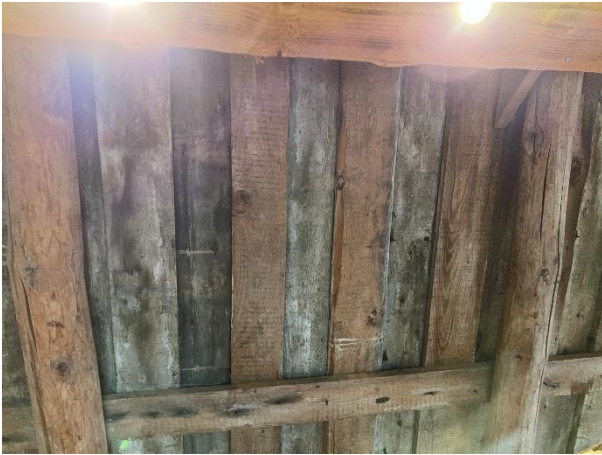
Synlig sutaksbord i innvendige tak på loft.