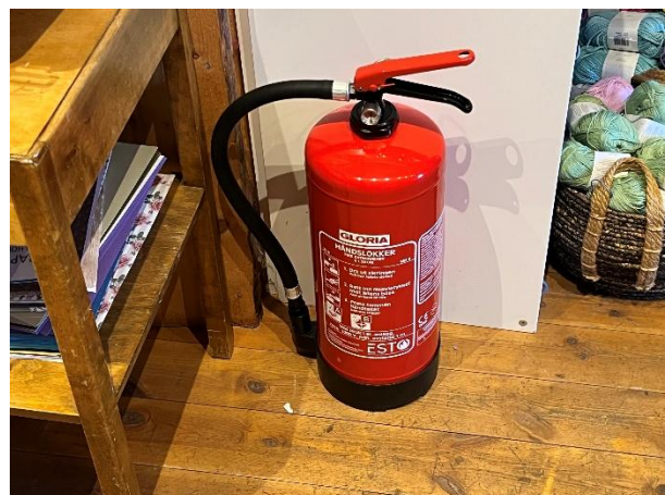
Pulverapparat i lokalene.