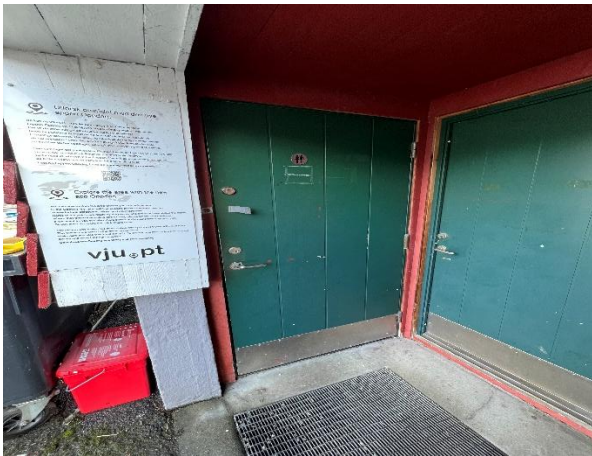
Malte ytterdører til toalettrom